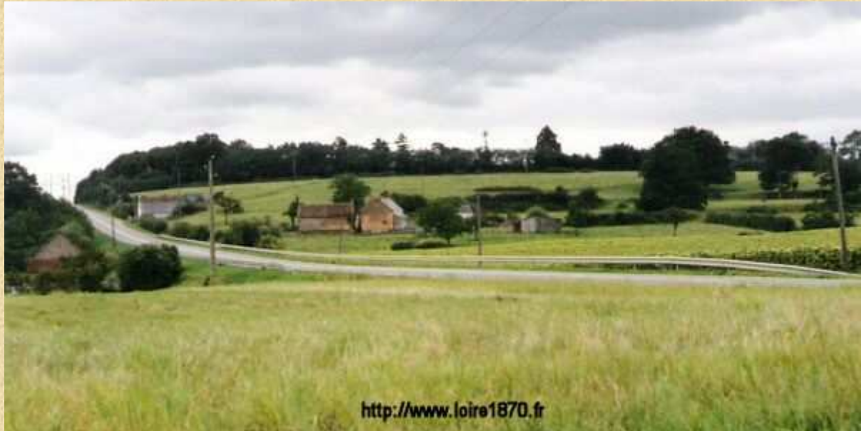
La colline de la Jaunelière