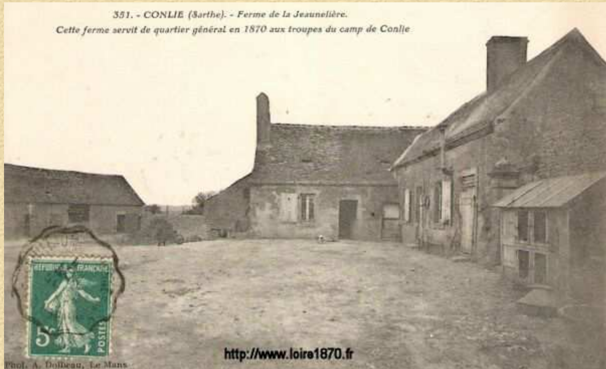
Ferme de la Jaunelière qui servit de quartier général

pour servir aux campements et empêchent tout exercice. Le 20 novembre, les fortifications du camp sont presque achevées. On attend la livraison d'armes provenant d'un surplus de la guerre de sécession acheté aux USA. Ces armes promises par Gambetta n'arrivent toujours pas et le manque de cadres instructeurs ne permet pas le contrôle de tous ces hommes livrés à l'oisiveté, l'ennui et le découragement.