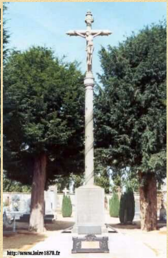
En 1873 est édifiée la "croix des bretons" dans le cimetière de Conlie.

Une plaque commémorative y est apposée le 14 février 1971 à l'occasion du centenaire.