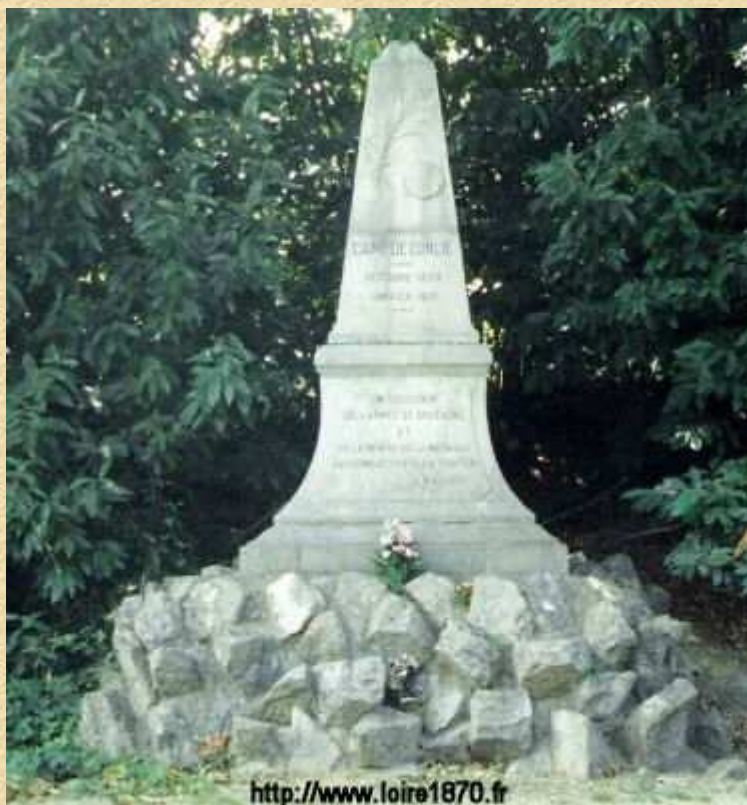
Un monument en souvenir du camp et de l'armée de Bretagne est inauguré le 11 mai 1913 sur la colline de la Jaunelière.

Le 14 janvier au soir les prussiens sont à Conlie et occupent le camp abandonné en grande hâte. Impressionnés par les moyens mis en oeuvre, ils décident de détruire le camp qui peut encore offrir aux français un point d'appui et font sauter les fortifications. L'occupation prussienne de la commune de Conlie ne s'achèvera que le 6 mars 1871. De toute la Bretagne, la colère gronde et dès 1871, une commission d'enquête est chargée d'établir un rapport sur les actes de la défense nationale. La longue déposition de Kératry traduit son ressentiment à l'égard de Gambetta. L'historien Arthur de la Borderie rédigera ce rapport consultable aujourd'hui dans les bibliothèques de Bretagne.